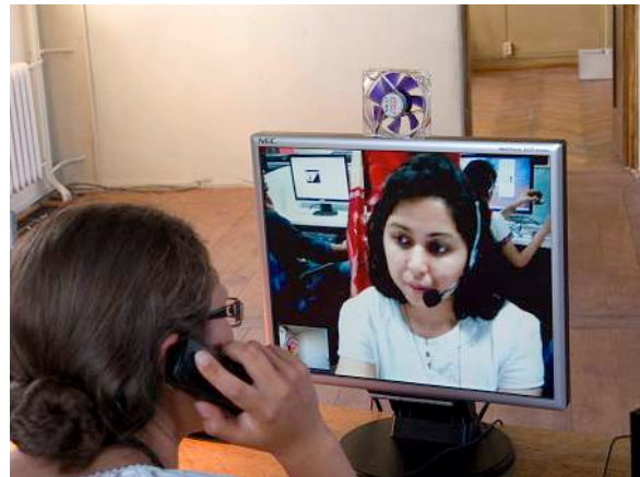
Call Cutta in a box, Rimini Protokoll, 2008.

Y finalmente incluimos a Call Cutta in a box , de Rimini Protokoll (Alemania, 2008) una pieza de teatro interactivo para un espectador, a través de un juego telefónico intercontinental entre India y algún país europeo. En esta obra el