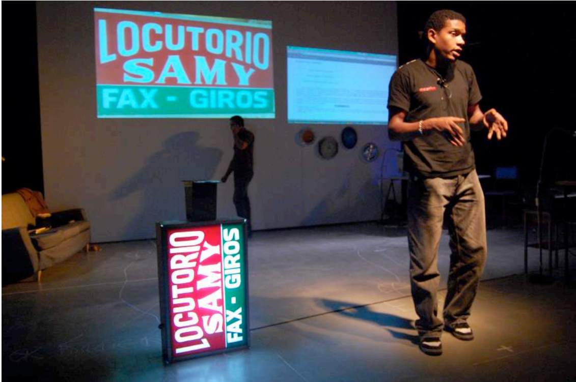
Escena de "Conectados (una obra de teatro-documental)", Matadero de Madrid, 2011.

Benja, el senegalés, muestra los papeles en trámite de su residencia y el pedido de expulsión que pesa sobre él. Dice que está cansado de que la policía lo detenga por su color, y abre las manos hacia el público mientras dice J'en a marre (¡Estoy harto!) que es un colectivo combativo Senegalés, y desencadena en escena una serie de reivindicaciones de cada vecino. Al finalizar la obra, aún no había un veredicto sobre su permanencia o posible deportación de España.